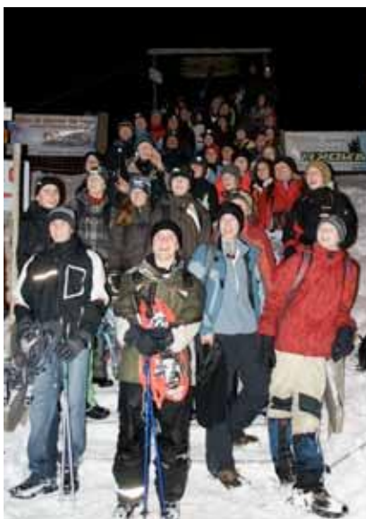
Cheminer avec joie et amitié

L'aventure au Chalet du Soldat , avec une quinzaine d'élèves qui ont pu continuer l'initiation à l'escalade, fut une expérience qui a permis d'établir un lien avec notre foi, dans la découverte de la parabole du roc et du sable. Un bol d'air pur pour une quarantaine de courageuses et courageux était également au rendez-vous lors de notre randonnée en raquettes au Gîte d'Allières , où nous avons pu partager des moments de réflexion et manger une bonne soupe de chalet. Marcher a été, un peu malgré nous, le leitmotiv de la semaine thématique à Paris : belles découvertes de richesses culturelles et spirituelles en cette ville. Une expérience plus intérieure s'est vécue durant l'Avent avec deux célébrations « Rorate » en l'église du Saint-Sacrement. Il a fallu se lever tôt pour partager ces deux moments de prière, dans une église illuminée d'innombrables bougies, rencontre conclue par un petit-déjeuner avant l'école. L'Avent fut aussi l'occasion de décorer notre école avec un chemin de lumière menant à la Nativité. Chaque jour, une nouvelle