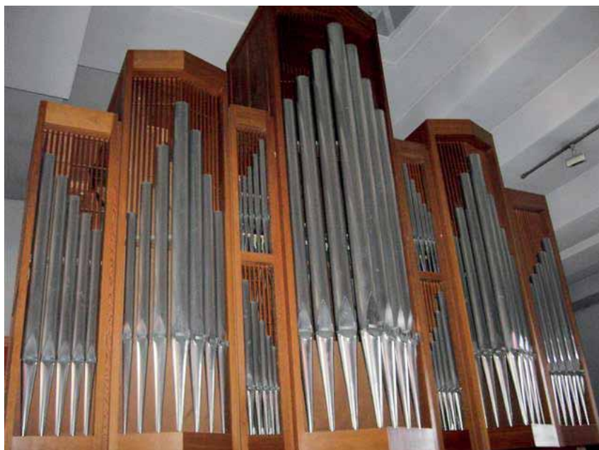
Un bel instrument pour chanter les louanges divines

De nombreux compositeurs vous emmèneront dans divers mondes musicaux: médiéval, de la Renaissance, baroque et plus moderne. A part les œuvres d'auteurs inconnus, il s'agit de