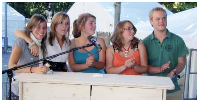
Le groupe vainqueur (moins un participant) tout de fierté légitime

Dans le cadre de Festibible de septembre dernier, plusieurs démarches se sont réalisées, dont le concours « défi-lecture Bible » proposé aux élèves des Cycles d'Orien-