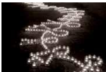
Lumière pour se retrouver

Toujours plus de person- nes participent : petits et grands se réjouissent de voir se former, au fil des heures, une plage étincelante de bougies, qui se métamorphose en lieu de solidarité et d'espoir. Les enfants s'émerveillent. Cet espace de lumière est alors propice au ras- semblement, à l'échange, à la convivialité, au recueillement.