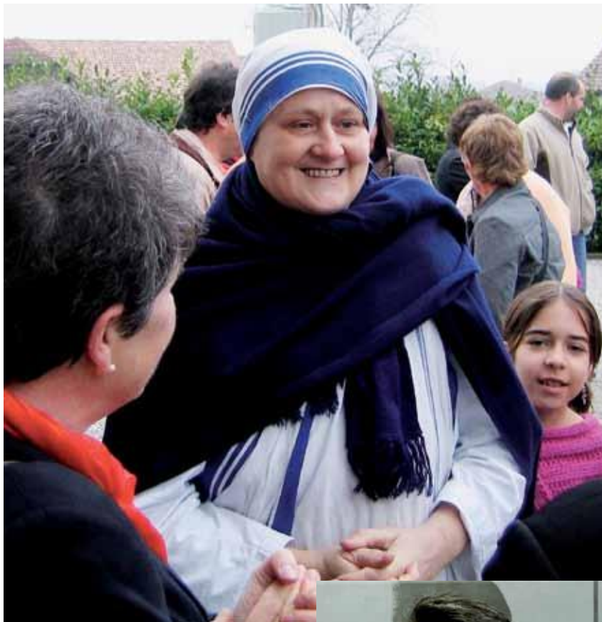
Quand entraide et sport s'unissent pour une bonne cause

... « Ici à Moscou, le mot "charité" n'existe pas. Nos œuvres sont considérées comme louches et notre attitude d'amour et de partage fait peur. Pour les dirigeants, ce n'est pas possible de donner sans rien recevoir en retour,