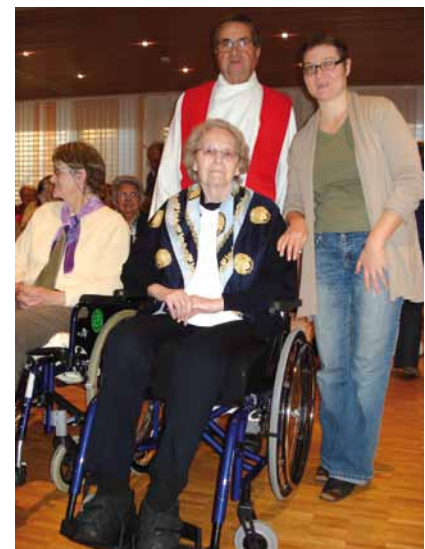
Les prêtres sont présents à l'aumônerie, un grand merci à eux!