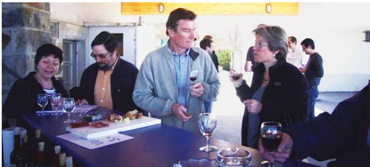
La connaissance par les papilles