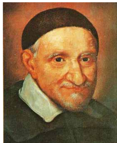
Vincent de Paul, prêtre-paysan au service des pauvres

- Treyvaux: Banque Raiffeisen: IBAN CH76 8015 0000 0101 6406 2