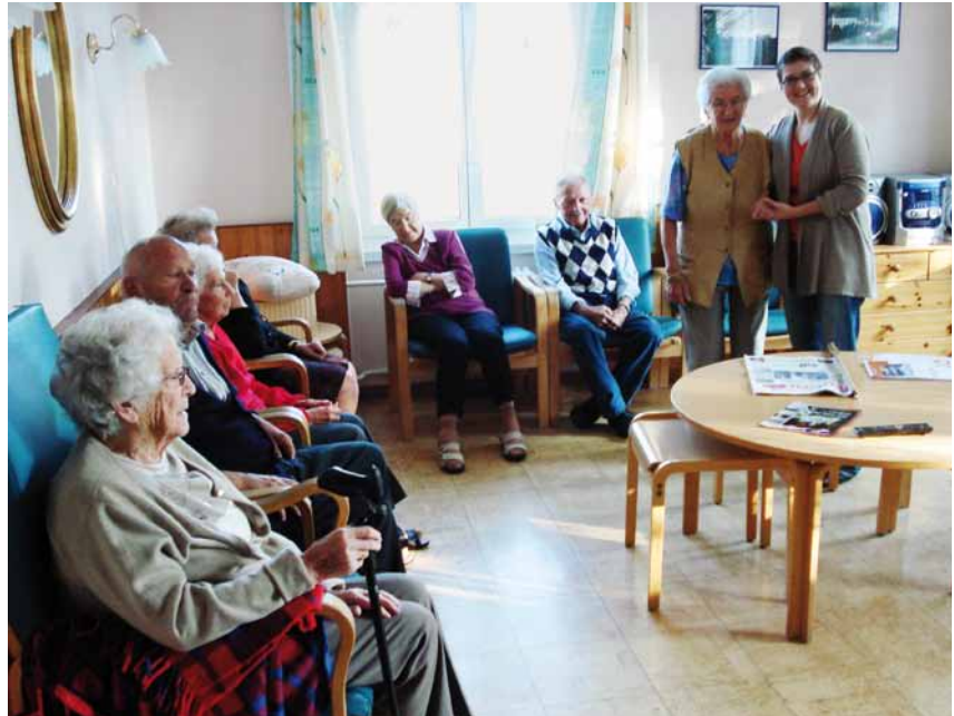
Aux Peupliers, quelques bons moments ensemble au salon

L'aumônerie est au service du bien-être intérieur des résidents. Dans des études sérieusement menées, les hôpitaux ont vu que les malades se portent