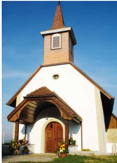
... «un petit coup de jeune» à la chapelle

Que ce soit du haut de la forêt d'Essert ou depuis le giratoire, que l'on vienne de la Riedera ou de la Crausaz, peu importe le point de vue, on la découvre, la Chapelle d'Essert, toute resplendissante!