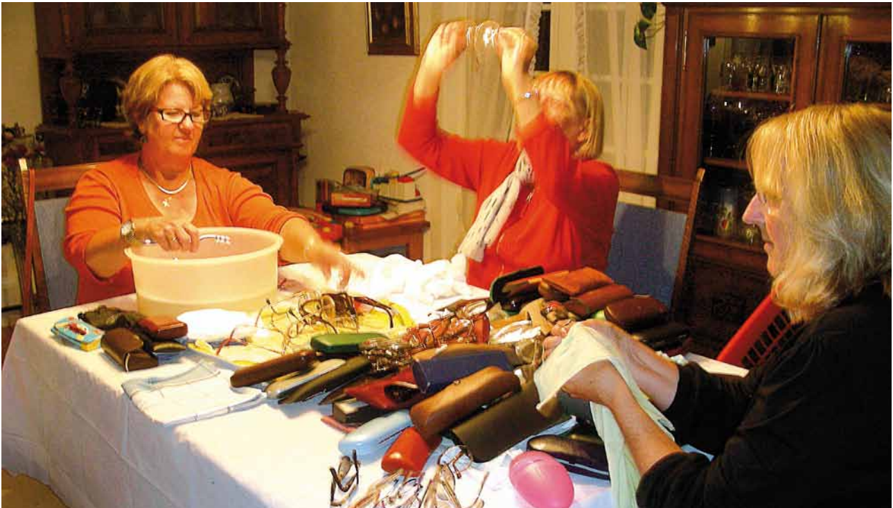
Des bénévoles aux petits soins