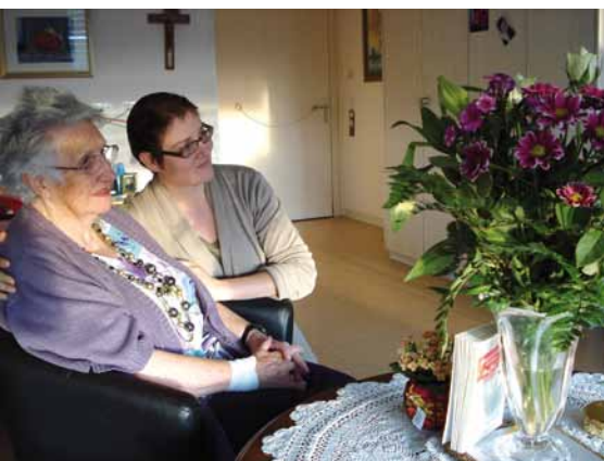
Jeter un regard sur le passé pour mieux vivre le présent