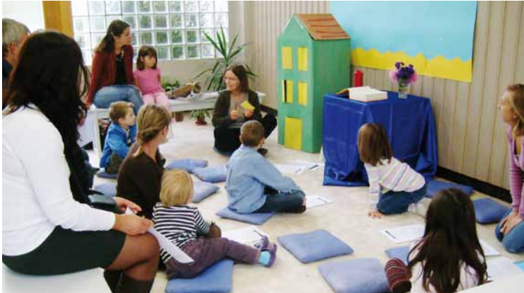
La maison s'éveille pour s'ouvrir à Jésus

Trouver un langage adéquat pour parler de Dieu aux enfants et cheminer avec eux pour qu'ils grandissent aussi bien dans leur âme que dans leur corps, c'est le but de l'Eveil à la foi. Ces rencontres rassemblent des enfants de 3 à 6 ans, accompagnés de leurs parents.