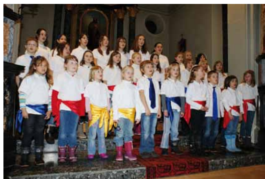
Concert de l'Avent, Arconciel, 2010