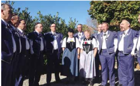
Petit concert improvisé après la messe.

Dimanche 18 octobre 2015, à 10h30 , à l'église paroissiale, messe chantée par le club Edelweiss de Fribourg. Vous êtes tous cordialement invités à venir partager ce moment privilégié, devenu traditionnel.