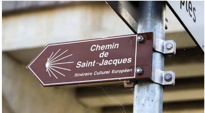
Les itinéraires spirituels sont de mieux en mieux balisés.

dernier, d'une statue de Jean-Paul II ce printemps, nombreuses affaires ici et là entre l'Etat et des particuliers – l'Eglise étant un particulier comme un autre au pays de sa fille aînée. On y dégage facilement les lois laïques, dont celle de 1905. Pourtant, la place de l'Hôtel-de-Ville à Paris a eu longtemps sa crèche, et on processionna chaque