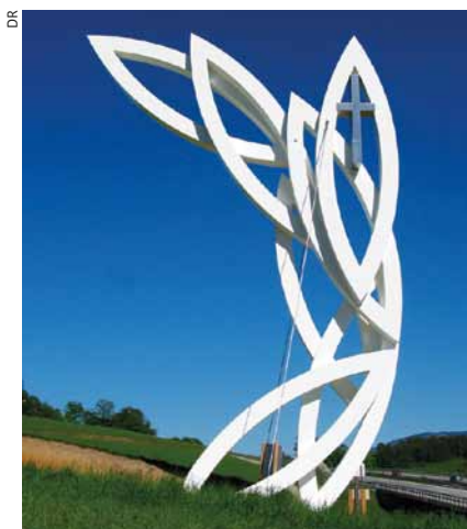
Au bord de la Transjurane, un épi artistique surmonté d'une croix discrète.