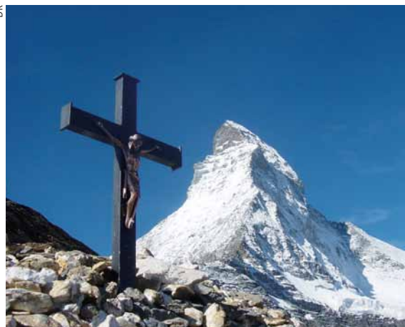
Les croix, un des signes de la visibilité de l'Eglise.

Les sept sacrements en sont des manifestations particulièrement denses, et les signes visibles – tels que des croix au long des chemins, au sommet des montagnes, dans les salles de classe, autour du cou des croyants, ou l'habit religieux et sacerdotal – ne sont qu'une expression extérieure de cet amour infini du Fils du Père pour la totalité de l'humanité. En adres-