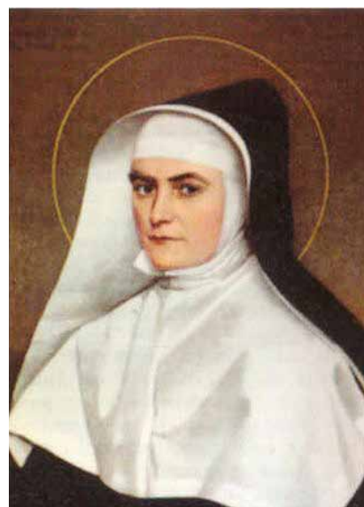
Sœur Jeanne-Antide Thouret, fondatrice de la congrégation.