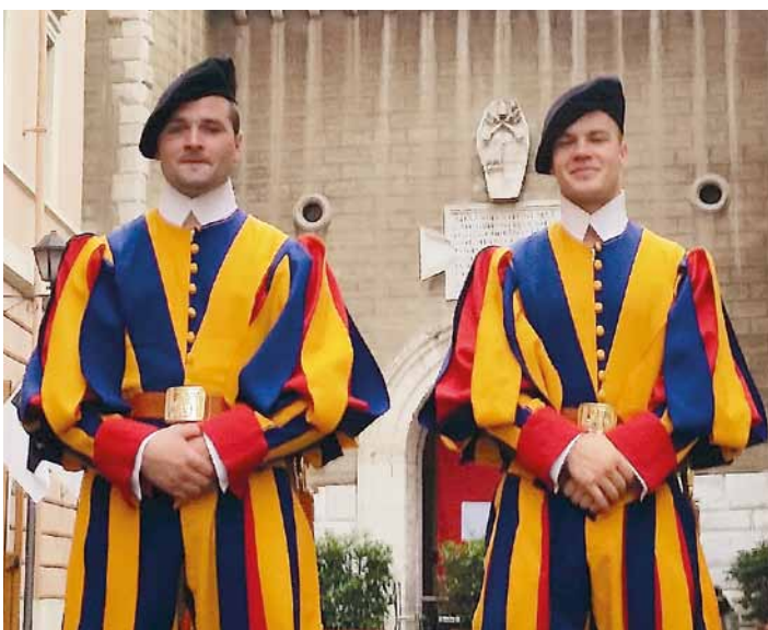
En tenue d'apparat.