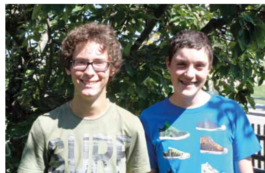
Fiers et heureux de leur engagement.

La fonction de servent de messe est une activité très méconnue. Etre servent de messe signifie évidemment servir Dieu mais aussi passer de très beaux moments avec des jeunes de tout âge. Notre paroisse compte peu de servants. Cet engagement très sympathique comporte aussi quelques réunions, sorties et autres activités (Europa Park; Rome; grillades...). C'est pourquoi nous vous encourageons, vous les plus jeunes, à vivre, tout comme nous l'avons fait, des moments inoubliables auprès des personnes qui nous accompagnent durant cette période de vie.