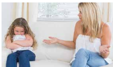
L'éducation des enfants n'est pas tâche aisée!