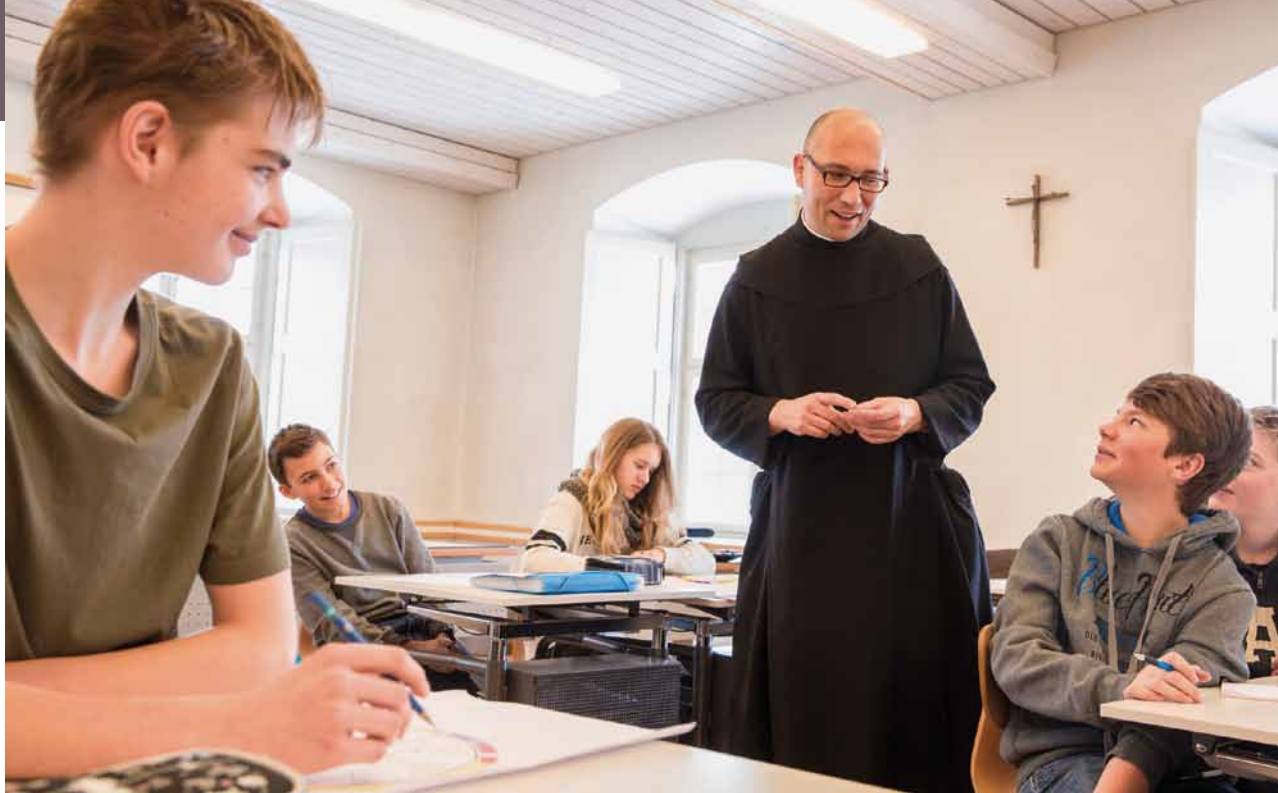
Des religieux enseignants: une réalité de plus en plus rare.

sont l'abréviation du latin Christus mansionem benedicat , à savoir: «Que le Christ bénisse cette maison.»