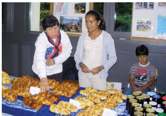
Journée d'entraide en 2011.

C'est avec un immense plaisir que nous vous convions à la traditionnelle rencontre des Mouvements d'entraide de Marly. Elle aura lieu samedi 17 octobre 2015 , à la Halle de Marly-Cité . Rappel du programme :