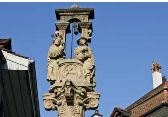
La fontaine de La Samaritaine en vieille ville de Fribourg.

Au pays des libertés, la laïcité élevée au rang de religion d'Etat n'en finit pas de provoquer, au sujet de l'espace public et républicain, des incidents qui prêteraient à sourire s'ils ne donnaient à pleurer: retrait de crèches l'hiver