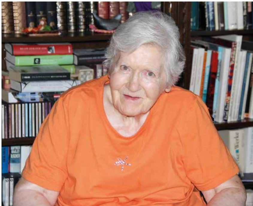
Une riche personnalité.

Née à Berne, elle effectue un apprentissage de secrétaire et connaît les conditions difficiles du temps de guerre où les salaires des apprentis s'élèvent à 15, 25 puis 50 francs par mois. L'expérience d'un travail à la campagne est une révélation pour Dori qui souhaite devenir paysanne. Fiancée à un agriculteur, elle a la douleur de le perdre avant le mariage et entreprend une formation d'infirmière en psychiatrie qu'elle interrompt, choquée par le manque de respect à l'égard des malades. Elle travaille ensuite dans une étude d'avocat et notaire puis dans une entreprise électronique, toujours à Berne.