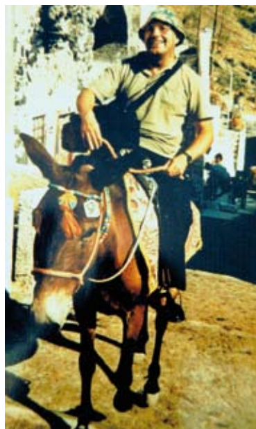
Sur un âne juché, en route pour la retraite