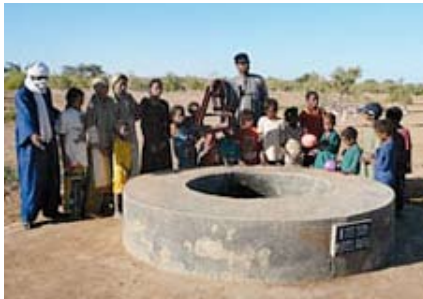
Puits au Niger

Autrefois, c'était le puits du mois d'août, mais aujourd'hui en raison des messes moins nombreuses durant l'été, et par conséquent des montants de quêtes plus restreints, cette action devient le puits de l'été .