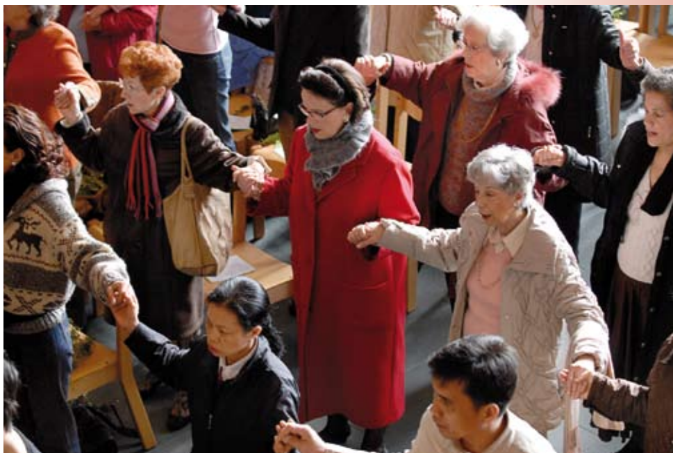
Une prière de communion et d'unité