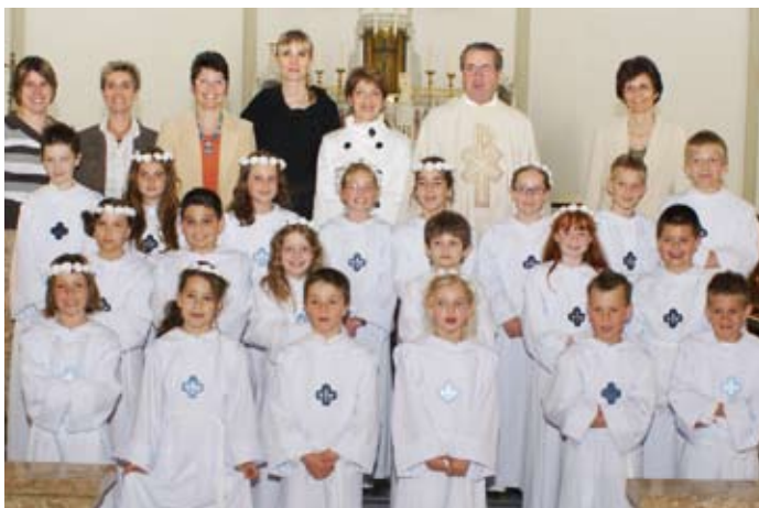
Treyvaux, 18 mai 2008