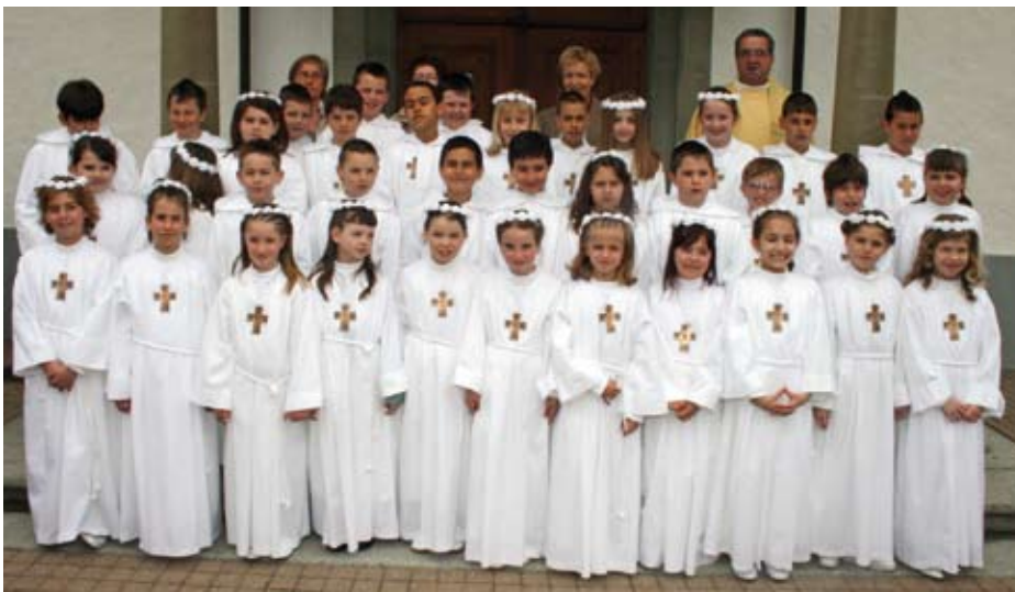
Marly, 20 avril 2008, église de Saints-Pierre-et-Paul