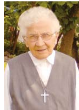
Une vie au service de la communauté