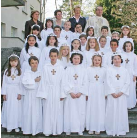
Marly, 27 avril 2008, église du Saint-Sacrement