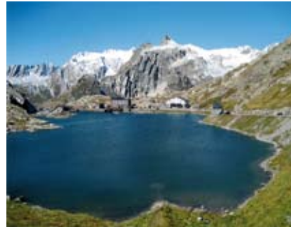
Un paysage qui invite à l'émerveillement et à la méditation

Ce pèlerinage aura lieu les samedi 26 et dimanche 27 juillet ; il convient à tous les bons marcheurs de 7 à 77 ans. Les enfants et les jeunes sont accompagnés par des moniteurs. Il faut compter 7 à 8 heures de marche avec des pauses régulières.