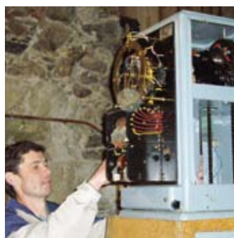
Un mécanisme automatique pour égrener le temps