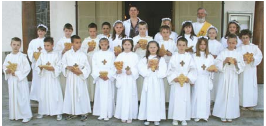
Bonnefontaine, 27 avril 2008, les enfants de l'école de Praroman