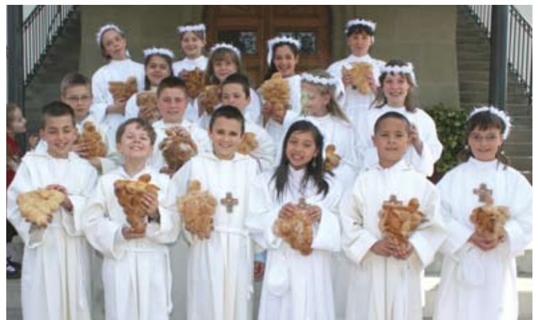
Praroman, 4 mai 2008, les enfants de l'école de Zénauva