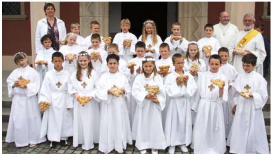
Ependes, 18 mai 2008, les enfants d'Arconciel et Ependes