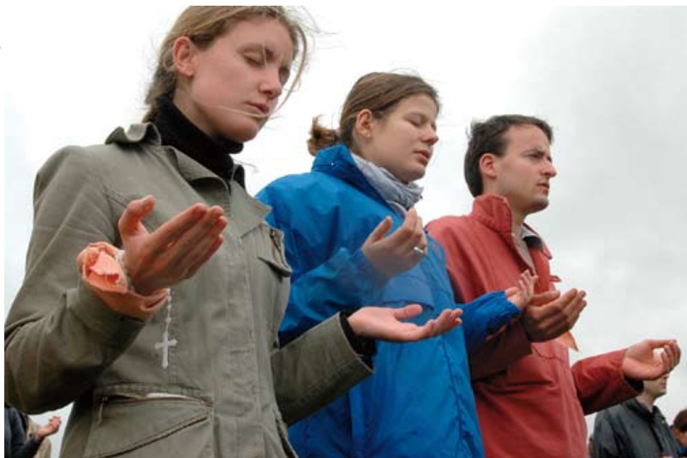
Les mains tournées vers Dieu, mendiant de l'essentiel

On relève aussi une question intéressante: «Si Dieu est saint, pourquoi demande-t-on de sanctifier son Nom?» En fait, il ne s'agit pas de demander que le Nom de Dieu devienne saint, car il l'est déjà, mais plutôt «qu'il soit reconnu pour ce qu'il est», ce qui revient à l'aimer, à le respecter, à ne pas le défier.