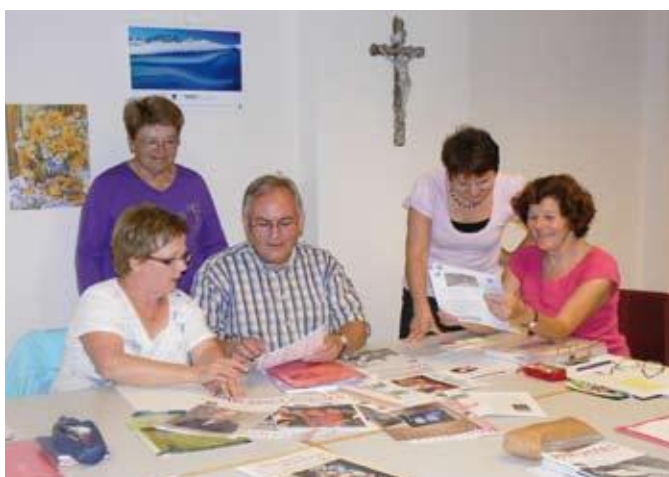
La foi, moteur d'engagement

L'amour fraternel que tu me donnes, ta sollicitude, ton goût pour la belle écriture, ta collaboration spontanée pour les correctifs me sont très précieux. Je te remercie très chaleureusement pour tout ce qui a été et pour tout ce que nous partagerons encore, sachant que je peux compter sur ton appui en cas de besoin.