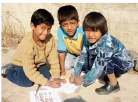
D'autres enfants à aimer, en Bolivie