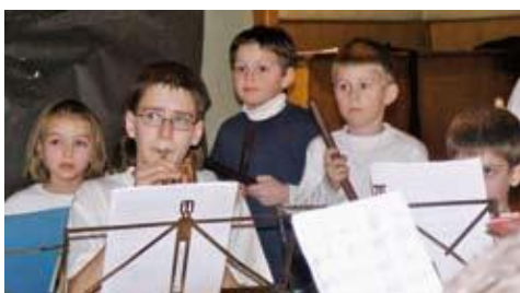
Ecole de musique, concert de l'Avent 2008