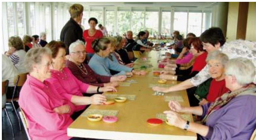
Plaisir de jouer et d'être ensemble