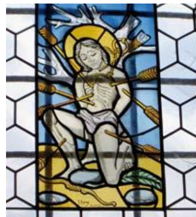
Chapelle d'Essert: vitrail de saint Sébastien

La fête patronale de la Chin Chayan aura lieu en la Chapelle d'Essert, dimanche 24 janvier 2010, à 10h . Cette année encore, nous aurons le plaisir de nous réunir pour passer un moment de ferveur et de convivialité, avec la participation du Chœur mixte de Treyvaux . A l'issue de la célébration, un apéritif avec les traditionnels petits pains sera offert à tous.