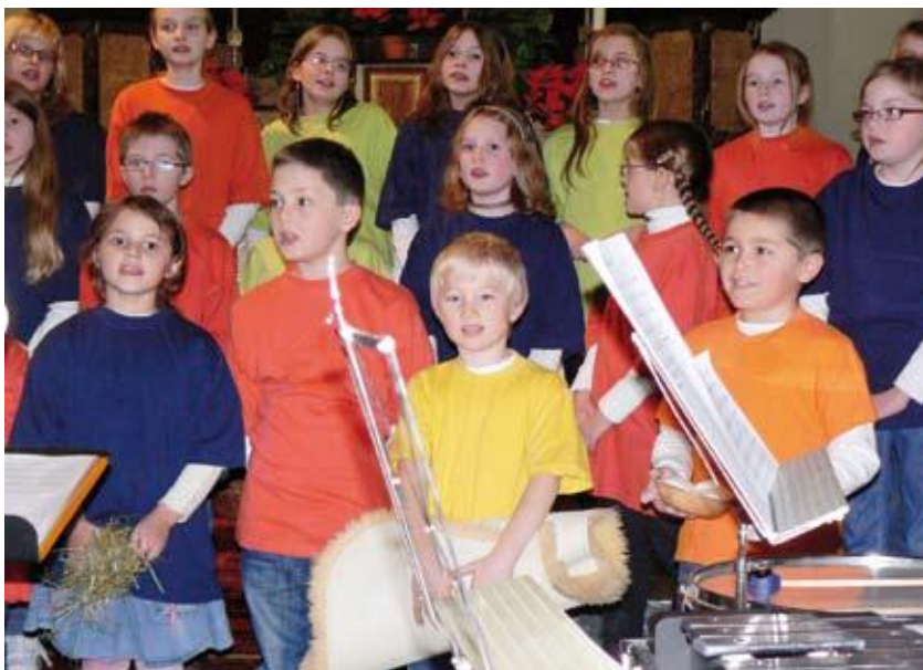
Les Baladins, en concert, décembre 2008, à Arconciel

Comme depuis plusieurs années maintenant, le concert de l'Avent, animé par Michel Riedo à l'orgue, le chœur d'enfants Les Baladins , le chœur mixte A Tout Cœur , la fanfare L'Espérance , la classe de 6 e primaire de M. Riedo, est fixé au dimanche 13 décembre 2009, à 17h, en l'église d'Ependes . L'entrée est libre. La collecte à la sortie du concert sera faite en faveur des Cartons du Cœur .