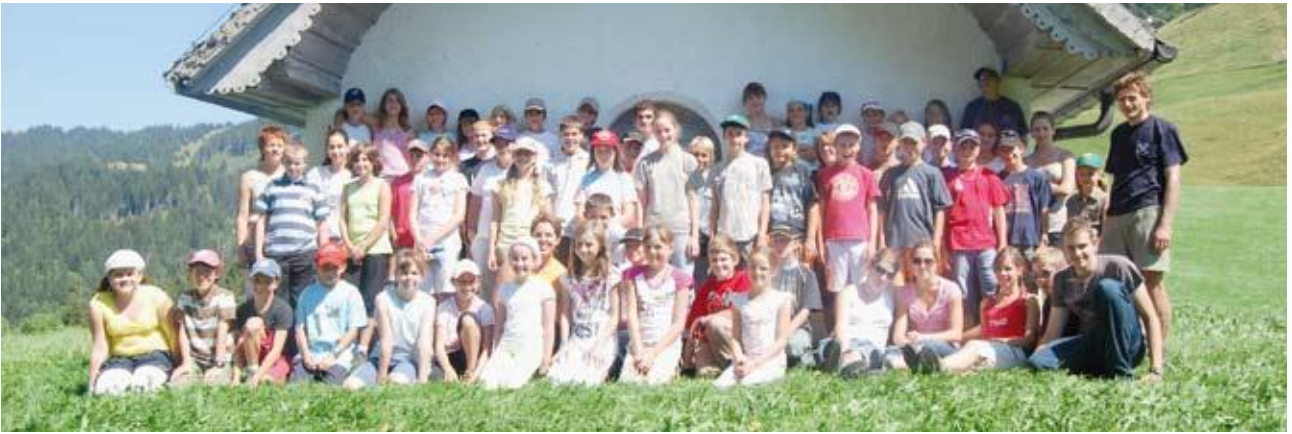
Rassemblés devant la chapelle de Saint Garin, au lieu-dit le Pré-de-l'Essert