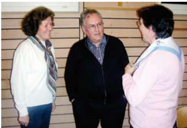
Joie et chaleur des rencontres

Joie de vivre et dynamisme Energie et courage Amitié chaleureuse Naturel et sens du prochain - le trait d'union, c'est l'humour Pédagogie, sens de la collaboration Intérêt et curiosité pour tout ce qui est humain Esprit positif et espérance Rigueur sans faille Rayonnement et richesse du partage Engagement généreux