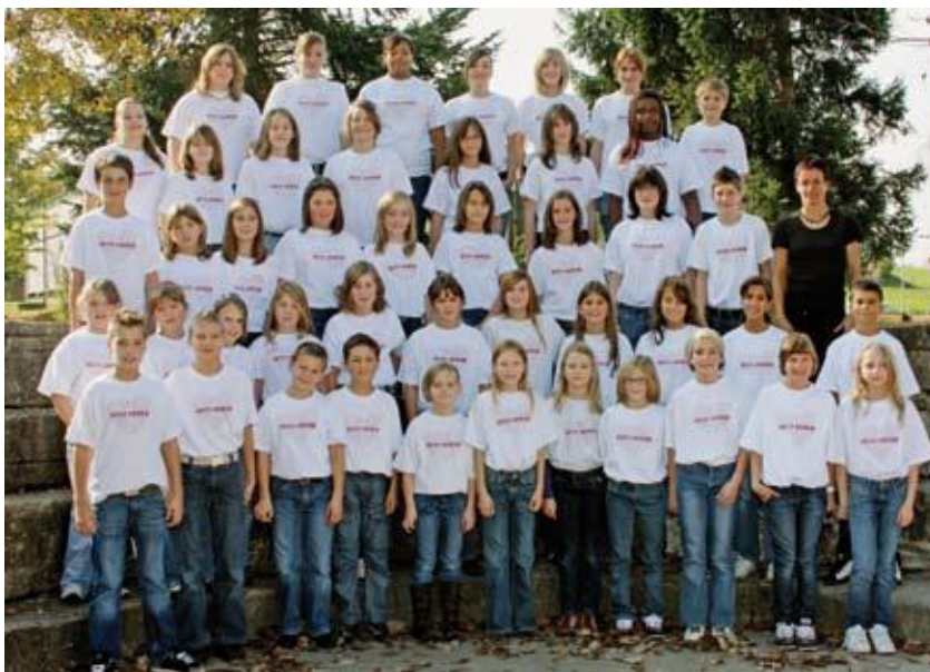
Voir le monde en couleurs, apporter du bonheur...