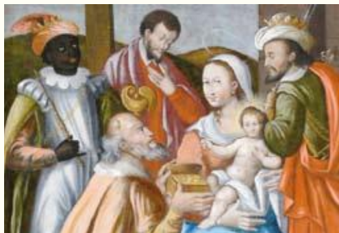
Tableau figurant à l'intérieur de l'église de Vers-St-Pierre

Vers-Saint-Pierre, dimanche 10 janvier 2010