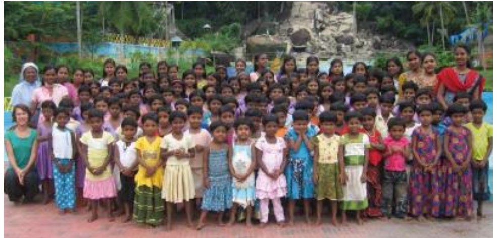
Epanouissement et bonheur dans un foyer aimant

Cette institution soutenue par la paroisse vient de vivre un important changement.