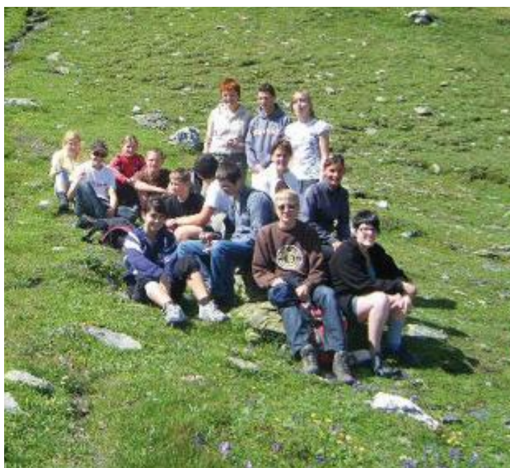
Halte bienvenue sur les sentiers du Grand-St-Bernard