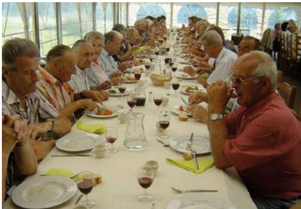
L'appétit vient en... voyageant!