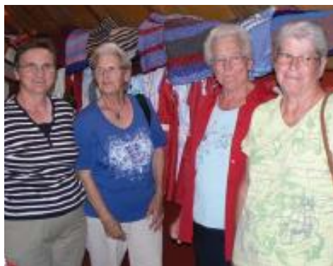
Savoir-faire et joie de se rencontrer

Le produit de tout ce travail est acheminé vers des pays où la pauvreté et les besoins sont énormes: au Rwanda où travaillent les sœurs hospitalières de Brünisberg, également en Inde dans les orphelinats de Mère Teresa et encore en Roumanie. Chaque destinataire a des besoins spécifiques: vêtements minuscules pour les nombreux prématurés de l'Inde; robes et shorts colorés pour les filles et les garçons du Rwanda; couvertures, pulls et bonnets chauds pour la Roumanie. Grâce à une collaboration fructueuse avec l'équipe missionnaire de Praroman, certains problèmes de transports, très coûteux vers ces destinations lointaines, ont été résolus.