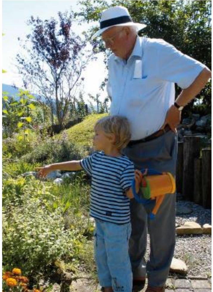
Avec Emile, ... tel Candide en son jardin

L'Histoire nous montre que souvent les religions ont été (sont encore?) des freins aux évolutions les plus positives de la société: autonomie de la société civile, égalité des citoyens, vote des femmes, liberté de conscience, respect de l'environnement... C'est bien tard que les Droits de l'Homme ont été reconnus par le magistère catholique comme un apport important de Civilisation. Et ce furent souvent des mouvements antireligieux qui ont finalement rendu service à l'Eglise en l'obligeant à abandonner l'illusion de pouvoir diriger une société pluraliste.