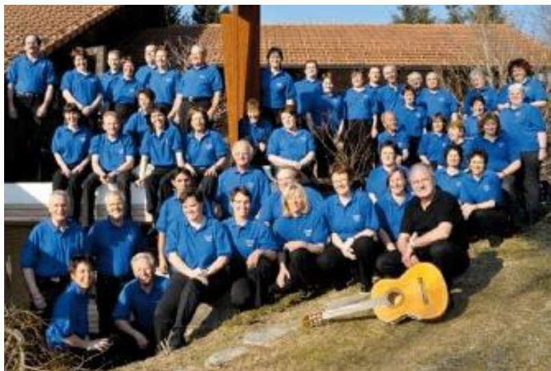
Symphonie en Bleu