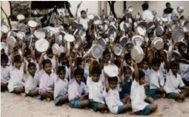
Effervescence avant la distribution du repas

La Paroisse de Marly, par le produit de plusieurs quêtes annuelles, assure le financement du programme de distribution de repas à plus de trois cents enfants, parmi les plus nécessiteux, qui fréquentent l'école des Sœurs du Couvent Saint-Joseph.