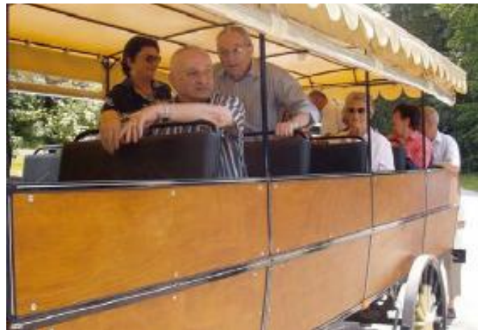
La petite diligence, sur les longs chemins de France... comme le dit la chanson