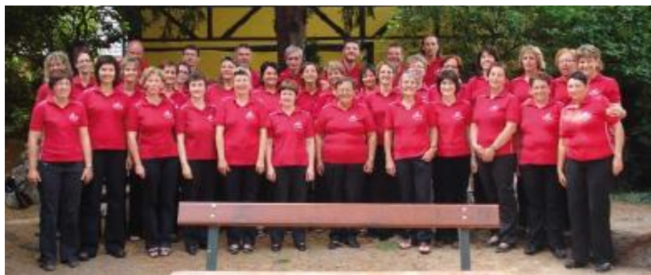
Voyage en Alsace-Lorraine, juin 2009