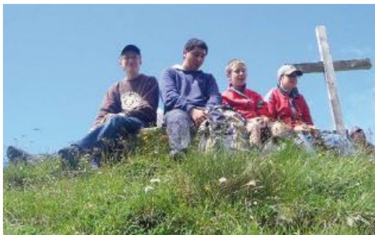
S'arrêter, admirer et méditer

Cet automne, 96 jeunes de notre UP recevront le sacrement de Confirmation. Le parcours est varié, avec des passages obligés et d'autres libres. Certains jeunes ont bien profité des démarches proposées. Après un entretien avec chaque confirmand en juin, il s'avère que 80% d'entre eux sont satisfaits du parcours proposé; mais pour certains, ce qui manque, c'est la présence d'un animateur, accompagnant toujours le même petit groupe, pour choisir ensemble les activités libres. Notre jeunesse est passionnante et c'est un honneur et un enrichissement incroyable que d'être avec eux dans ce parcours.