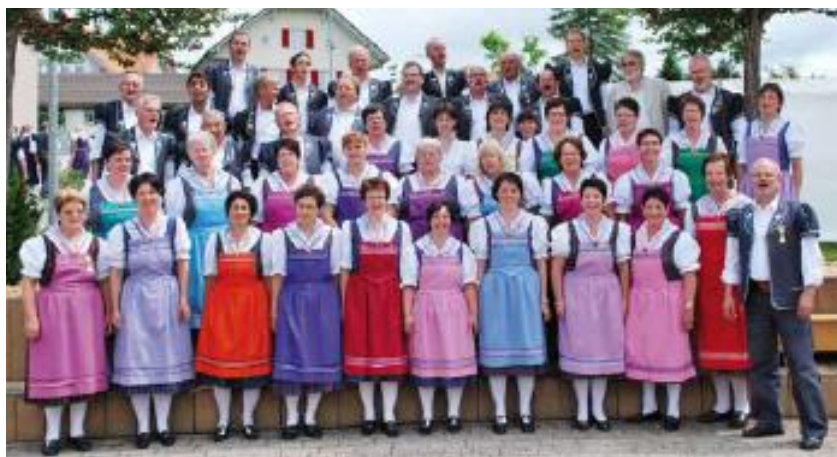
Lors des Céciliennes, à Arconciel, en 2010