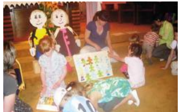
Rassemblement d'Eveil à la foi à Ependes en 2010