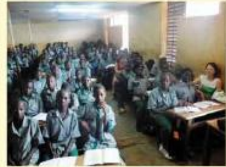
Une classe studieuse