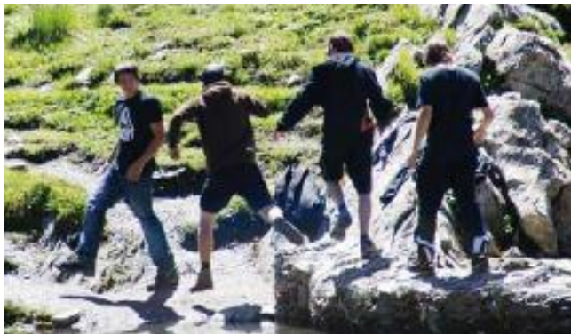
Grand-St-Bernard 2010, quand les jeunes jouent à saute-ruisseau