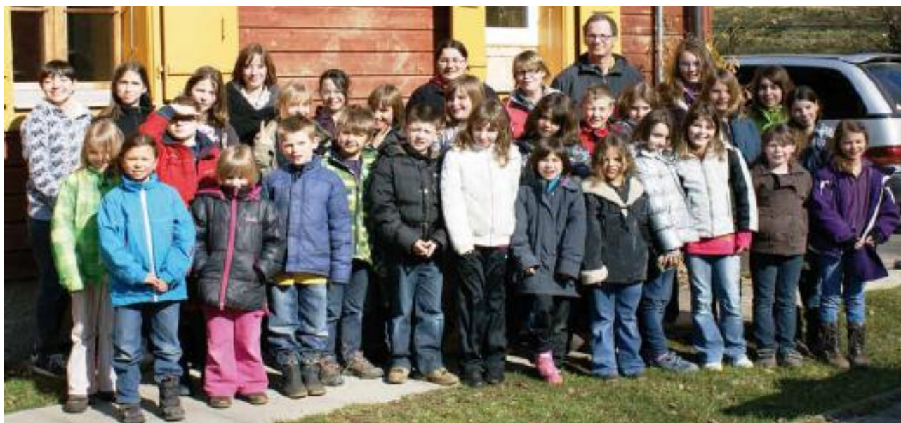
Lè Grijon; camp musical 2011, à Sonnenwyl