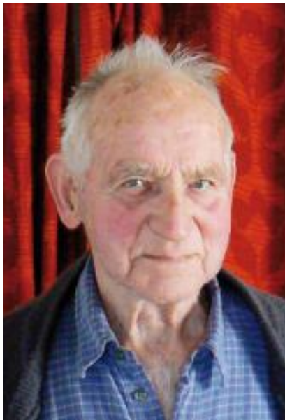
Un nonagénaire plein de sagesse

Le monde actuel est si différent de celui qu'il a connu dans sa jeunesse: travail mécanisé, révolution des transports, confort des habitations, progrès du système de santé... Et pourtant tout ce temps est passé très vite selon lui. Il faut dire qu'il appartient à une génération qui a appris à travailler très jeune et dont la dure vie de labeur ne s'est jamais arrêtée. Agriculteur et éleveur durant toute sa vie, ancien inspecteur du bétail, il se lève aujourd'hui encore chaque matin