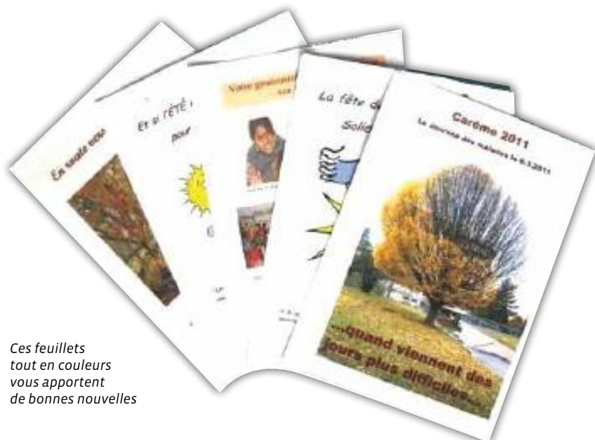
Ces feuillets tout en couleurs vous apportent de bonnes nouvelles

Tiré du : Clochard philosophique , G. et A. Prin