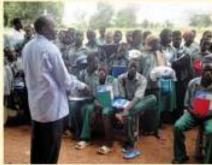
Distribution de matériel scolaire

« C'est un vrai plaisir et une chance de savoir que nous allons essayer de nous rapprocher en échangeant nos modes de vie et en donnant un peu de notre temps. Si notre environnement est différent, nos objectifs sont les mêmes: faire de l'école un lieu de construction des savoirs et des personnes... »