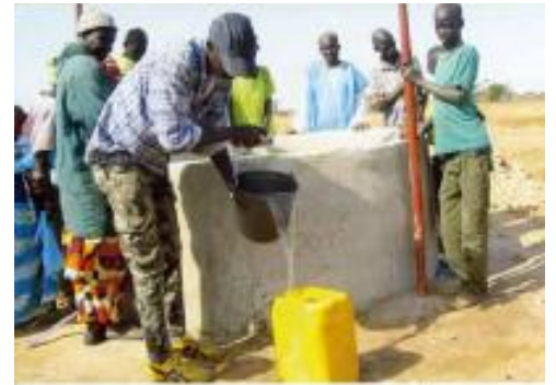
Puits Unité Sainte-Claire 2010

Le solde de votre généreux geste a servi et sert encore à distribuer de la nourriture à des familles dans le besoin. Les prix des denrées de base sont trop élevés par rapport aux moyens dont disposent la plupart des familles. Bien entendu, une partie du montant a été utilisée pour des soins médicaux,