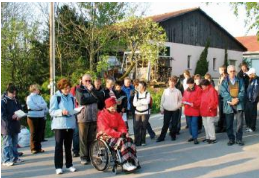
Temps de prière sur la route de Bourguillon

Il aura lieu dimanche 1 er mai . Départ de la place de l'église de Praroman , à 5h30 , pour un parcours de 9 kilomètres hors de la circulation, dans un cadre favorable à la prière et aux échanges.