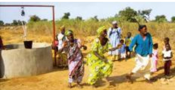
Danse de remerciement

Comme le montant était important, nous avons fait construire un