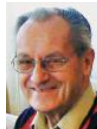
14 ans de dévouement à notre église

Depuis mars 2011, les portes de notre église sont munies d'un système de fermeture automatique que chacun a eu ou aura l'occasion de tester. C'est le moment de