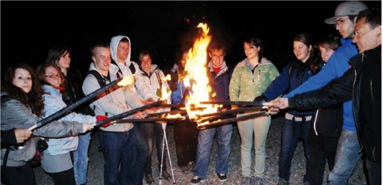
Même enthousiasme, même feu