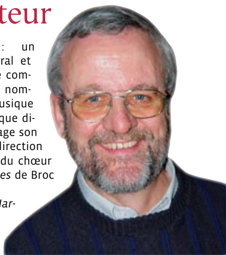
La compétence d'un professionnel

Nous nous réjouissons pour cette saison qui débute... et si le cœur vous en dit, n'hésitez pas à venir nous rejoindre, le mardi soir à 20h. Amitié et convivialité garanties!