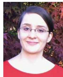
L'ardeur de la jeunesse