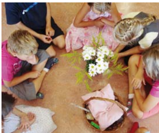
Un moment de partage spirituel

La joie de voir leur curiosité et de voir leurs yeux briller à l'écoute des récits de la Bible ou d'autres histoires, pourraient vous combler? Pourquoi pas vous? Devenez catéchistes, soyez les bienvenus.