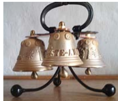
Merci aux généreux donateurs

A la chapelle d'Essert, il manquait un petit tintement