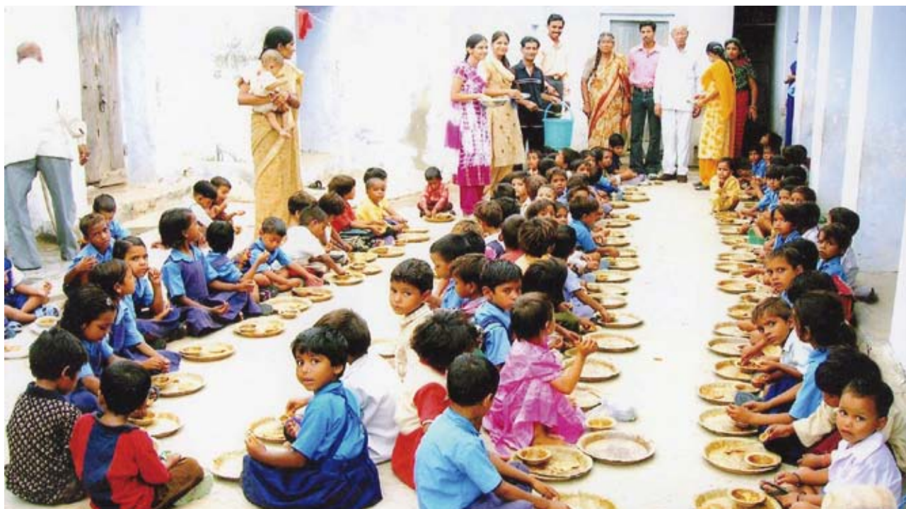
Des enfants au regard expressif et qui méritent notre soutien