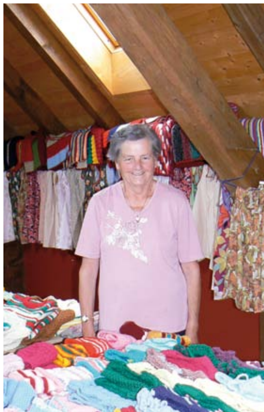
Sourires, couleurs et amitié

Un groupe de tricot, couture et crochet se rencontre le jeudi après-midi à 13h30 toutes les trois semaines environ au dernier étage de l'école d'Arconciel . Il reprendra ses activités jeudi 10 novembre . Le produit de tout ce travail est acheminé au Rwanda, en Inde et en Roumanie, dans des foyers et des orphelinats qui viennent en aide aux plus démunis. Que vous soyez ancienne ou nouvelle, vous serez la bienvenue dans ce groupe sympathique. Et félicitations pour ce bel engagement.