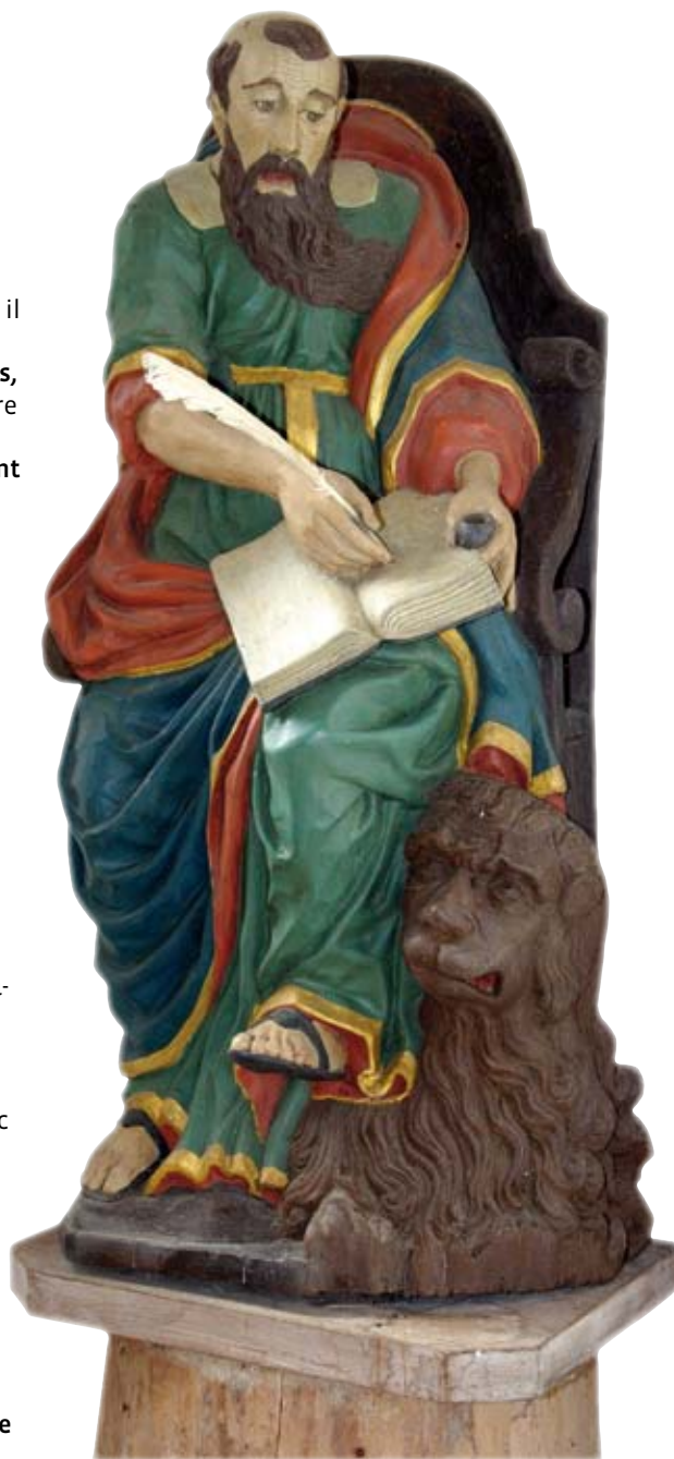
Saint Marc, chapelle Ste-Marguerite, Logonna-Daoulas (France)

Appel: Dans notre UP, plusieurs groupes vont se former, n'hésitez pas à vous annoncer au secrétariat de Marly (voir p. 2), seul ou à plusieurs, si vous souhaitez créer ou vous associer à un groupe pour vivre cette belle expérience.