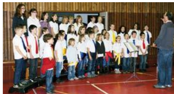
Lè Grijon lors de la Saint-Nicolas, à Treyvaux, 2011.

Le chœur d'enfants de Treyvaux, Lè Grijon, se fait un plaisir de vous annoncer son concert annuel qui aura lieu à la grande salle de l'école de Treyvaux, samedi 5 mai 2012 à 20h , en compagnie des Cadets de la fanfare de Treyvaux. Boissons et sandwiches en vente sur place. Entrée libre. Collecte.