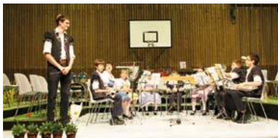
L'école de musique, concert 2010.