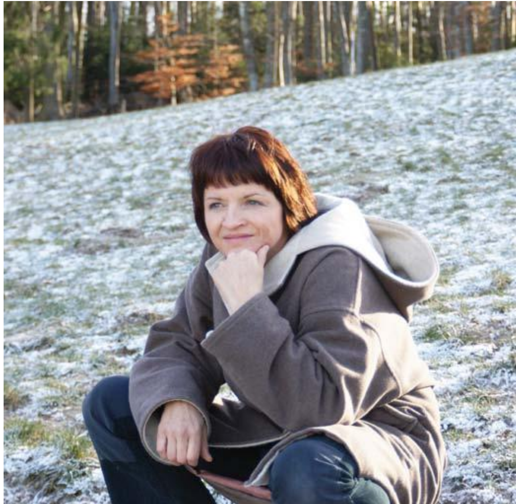
Instant de louange dans la nature.

On peut dire que j'ai « managé » durant deux ans ce parcours, mais si on ne veut pas s'essouffler et tomber dans le fonctionnariat, il faut pouvoir compter sur d'autres accompagnants, comme les parents ou autres volontaires, pour des activités ciblées, choisies par eux. Le management d'un groupe implique sa gestion, en déléguant, mais surtout en se laissant épauler, conseiller et nourrir par le partage de sa foi. C'est tellement important de pouvoir m'arrêter sur ce que je vis, sur Celui qui me fait vivre et agir, de prendre conscience comment je me laisse rejoindre par ce Dieu que je cherche et qui me cherche.