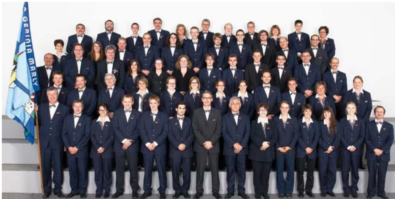
Une formation dynamique au service de notre communauté.

Les animateurs et animatrices du parcours de confirmation de notre Unité pastorale remercient chaleureusement La Gérinia pour sa fidélité. Chaque année, cette harmonie anime magnifiquement l'apéritif, après la célébration de la confirmation des jeunes de Marly (et quelques autres!)