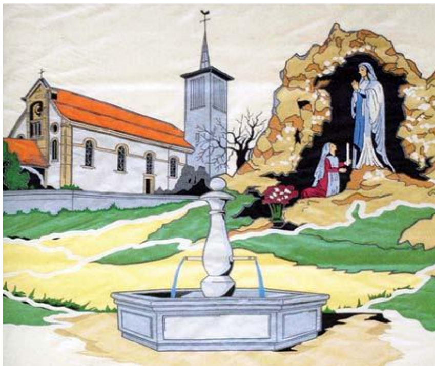
Bannière du Chœur mixte.

Le Chœur mixte de Bonnefontaine a le plaisir de vous inviter à son concert de printemps qui aura lieu samedi 12 mai 2012, à 20h, à l'église de Bonnefontaine.