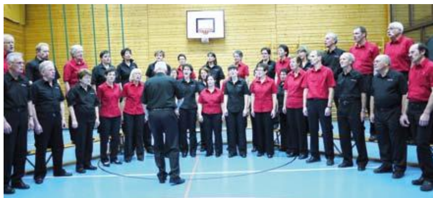
Concert Sainte-Cécile, 2011.