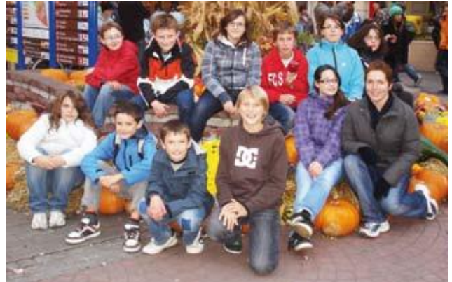
Sortie des servants de messe 2011.

Dans le car, on s'est dit qu'on avait tous réussi à vaincre nos peurs. Ensuite nous avons commencé à chanter, puis certains se sont endormis.