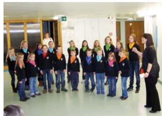
Lors d'un concert à l'Hôpital cantonal.

Le chœur d'enfants Les Baladins vous invite à son concert annuel, samedi 24 mars 2012, à 19h30 , à la halle polyvalente d'Ependes . Les jeunes chanteurs d'Ependes, Arconciel, Ferpicloz et Le Mouret vont vous faire partager une heure de plaisir à travers des airs qui invitent au voyage, à l'amitié, à la paix, aux rires.