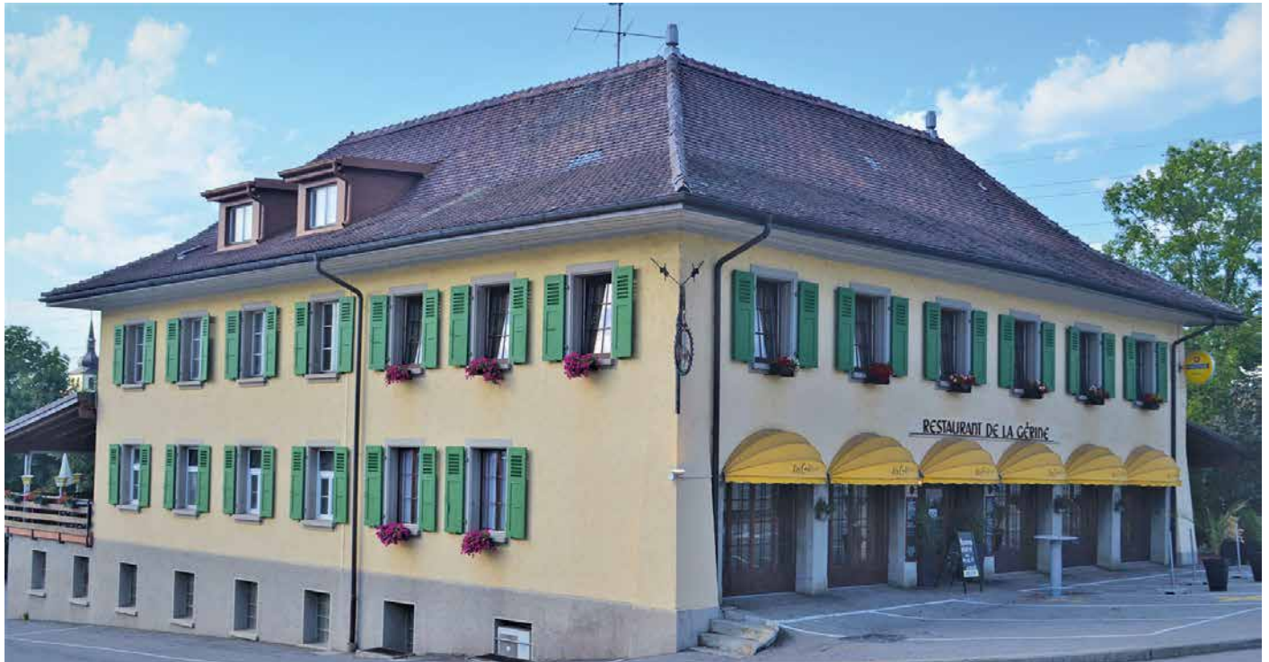
Restaurant de la Gérine Marly.