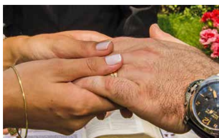
Accueillir Dieu dans nos familles, ça fait la différence.