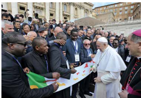
Selon François, l'attitude missionnaire consiste à se faire proche d'autrui.