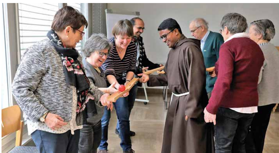
La mission est aussi à notre porte.