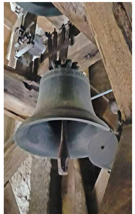
Cloche de l'agonie.

Nous nous réjouissons que ces quatre cloches, silencieuses depuis l'abandon de la sonnerie à la corde en 1969, puissent à nouveau se faire entendre dans notre village!