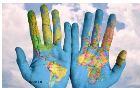
De toutes les nations, faites des disciples.