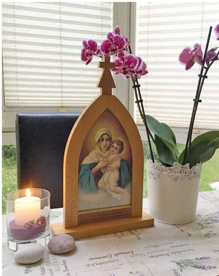
La Vierge Pèlerine de Schönstatt: une invitée de marque.

Voir aussi le site: www.merepelerine.com