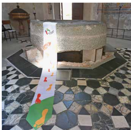
Riva San Vitale, où s'ouvre le Mois missionnaire extraordinaire.