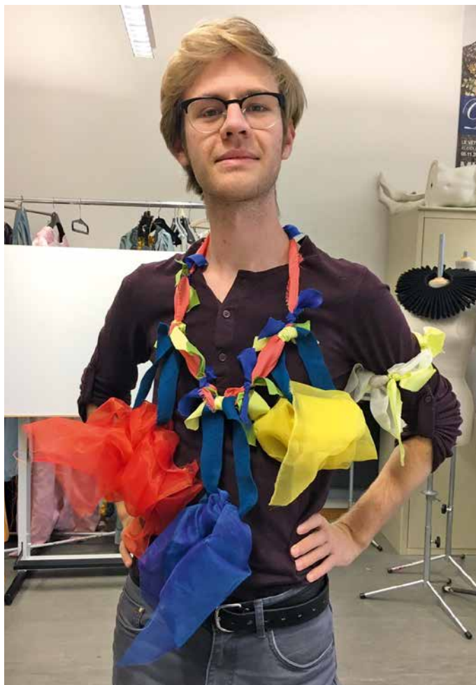
PAR JÉRÉMIE BIELMANN, 24 ANS

A consulter aussi le site de www.formulejeunes.ch