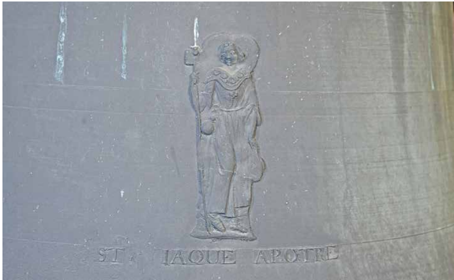
Détail de la cloche Saint-Jacques.