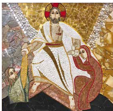
La Résurrection, à Champ-Dollon.