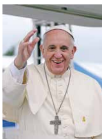
Le pape François