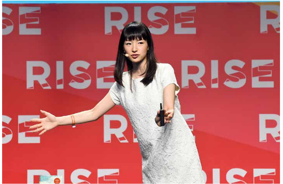
Marie Kondo, la papesse du rangement minimaliste.

Le Tokimeku , cela vous dit-il quelque chose ? Pas de doute, vous êtes passé à côté du phénomène Marie Kondo, la papesse du rangement minimaliste. Accrochez-vous, car vous pourriez bien devenir un adepte de cet art à la fin de ce dossier ! Plaisanterie mise à part, la Japonaise à succès n'a rien inventé, car le renoncement à la possession de biens matériels pour se mettre à la suite du Christ existe depuis bien longtemps dans l'Eglise.