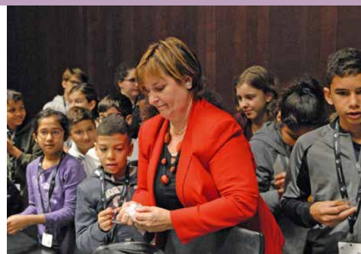
Une délégation d'enfants TAPORI, reçue le 24 octobre 2019 au Palais fédéral par Marina Carobbio, alors présidente du Conseil national.

Ce week-end de décembre sera l'occasion pour les enfants de se retrouver, de pouvoir partager leurs différents « trésors » et