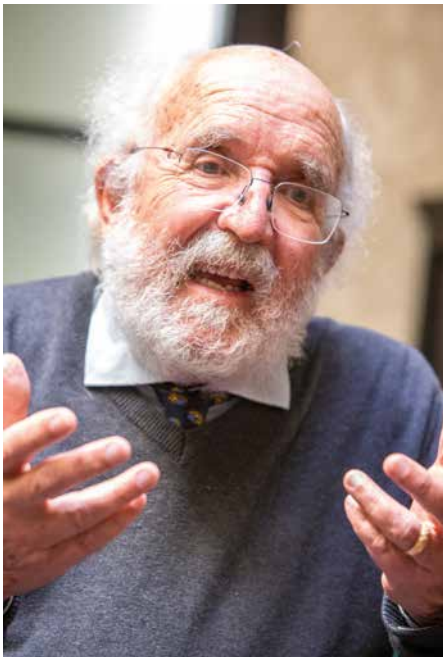
Michel Mayor, Prix Nobel de physique en 2019.

Imaginons que les choses aient été différentes et que nous ne soyons pas là. On ne se poserait même pas la question. Le fait que nous soyons là et que nous bénéficions du fait que cela a fonctionné ne nous permet pas de faire des statistiques. De là à dire que cela a été voulu par une puissance supérieure... Nous n'avons aucun élément pour le dire. Il nous faut donc garder une certaine modestie. (En