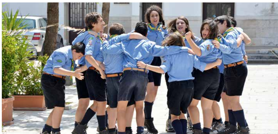
Certaines activités comme le scoutisme permettent l'acquisition de valeurs humaines.

Le budget des activités extra-scolaires n'étant pas extensible, le temps disponible non plus, voilà autant de raisons d'appeler le jeune à une formulation approfondie de ses désirs. En attendant, il nous revient à nous d'oser proposer ce qui semble le plus formateur pour chacun.