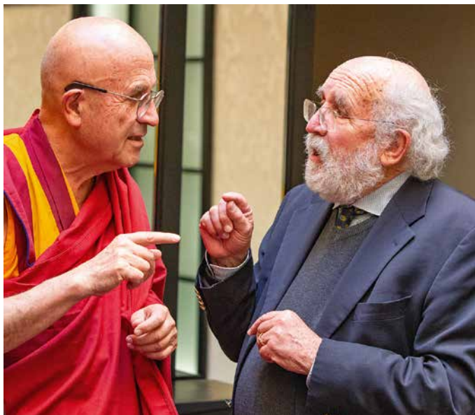
Michel Mayor, en discussion avec l'essayiste Matthieu Ricard.

cosmologie, cette notion se trouve à la base du principe anthropique fort, postulant qu'une variation, même infime, de certaines constantes fondamentales, n'aurait pas permis à la vie d'apparaître dans l'univers, ndlr.)