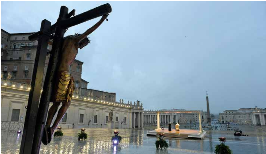
En pleine crise sanitaire, participation minimale pour un effet de communication maximal !