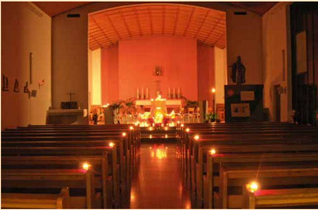
Temps de prière Rorate à l'église du Saint-Sacrement.

* Rorate: terme utilisé pour les célébrations de l'Avent exprimant l'attente de l'avènement du Messie.