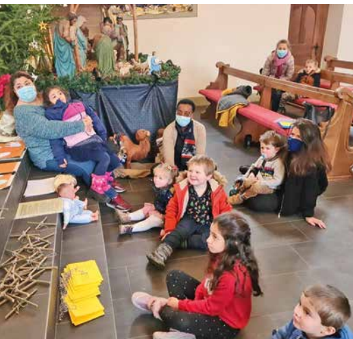
Rencontre de l'Eveil à la foi. Eglise de Praroman, samedi 19 décembre 2020.

PAR L'ABBÉ DARIUSZ KAPINSKI