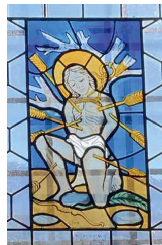
Saint Fabien et saint Sébastien, patrons de la Chin Chayan.