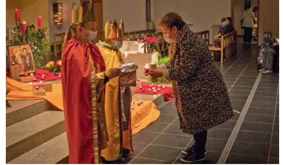
La Lumière de la Paix a fait halte à l'église Saint-Paul, à Fribourg, dimanche 13 décembre 2020.

Dans notre UP, la Lumière de la Paix sera amenée dans chacune de nos églises lors des célébrations des 18 et 19 décembre.